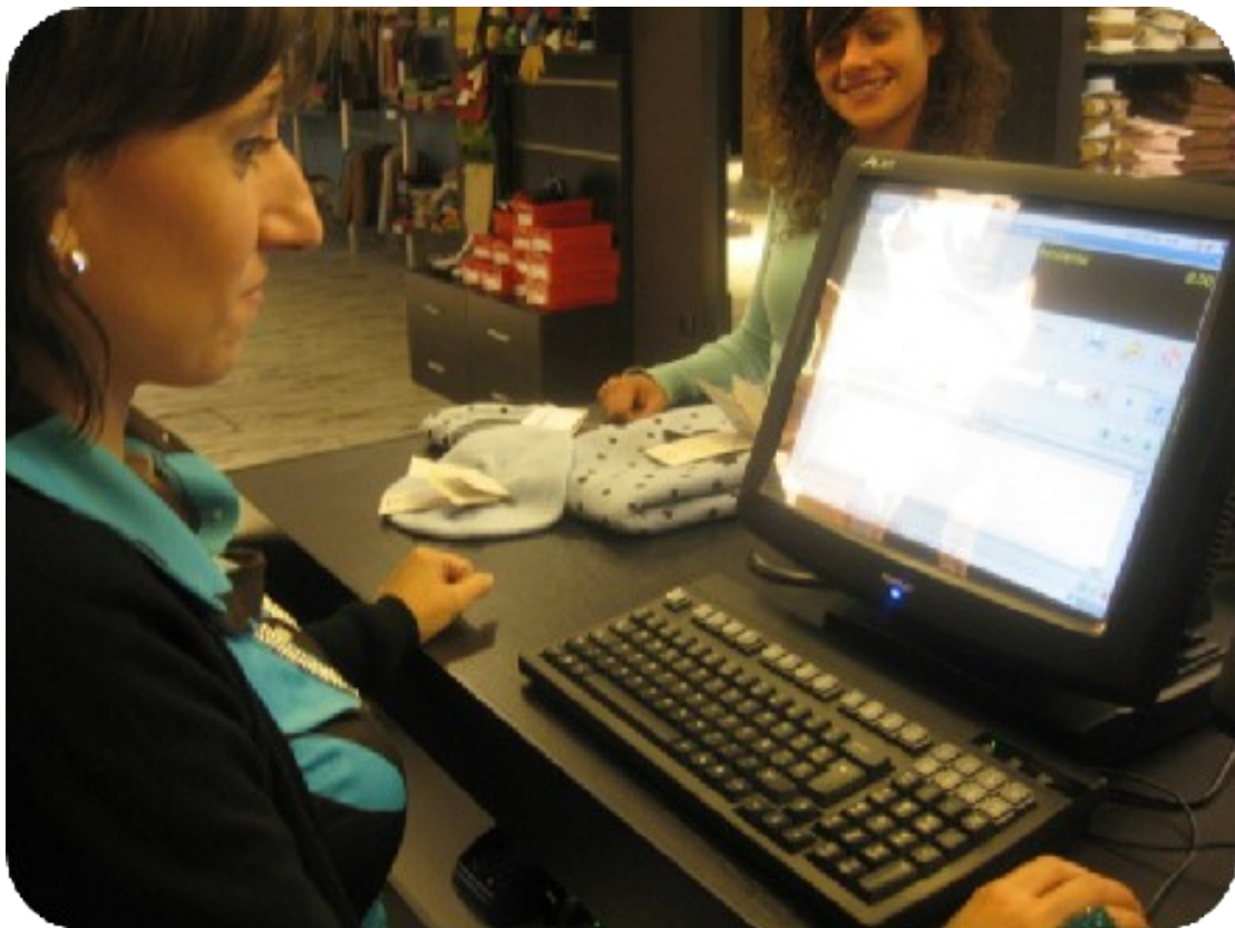
Terminal de venta con RFID sobre Software AbanQ