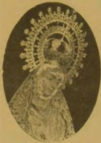
Ntra. Sra. de los Remedios Patrona de La Roda y Fuensanta